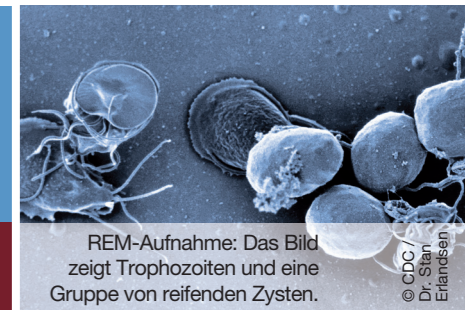
REM-Aufnahme: Das Bild zeigt Trophozoiten und eine Gruppe von reifenden Zysten.

Überarbeiteter Teil der ESCCAP-Empfehlung für die Schweiz, Nr. 6: «Bekämpfung von intestinalen Protozoen bei Hunden und Katzen»